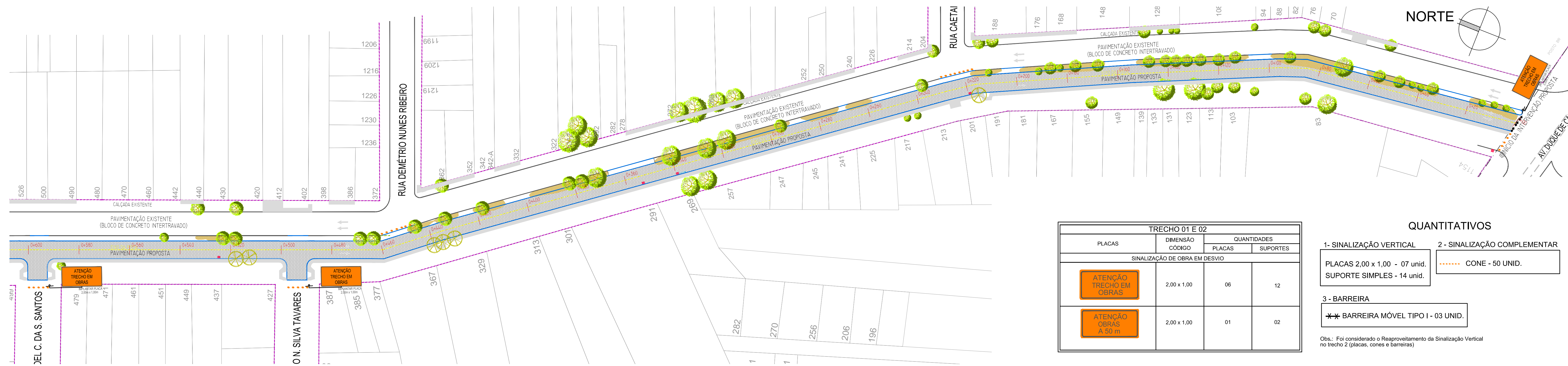
PLANTA BAIXA TRECHO 2 ESC. 1:750