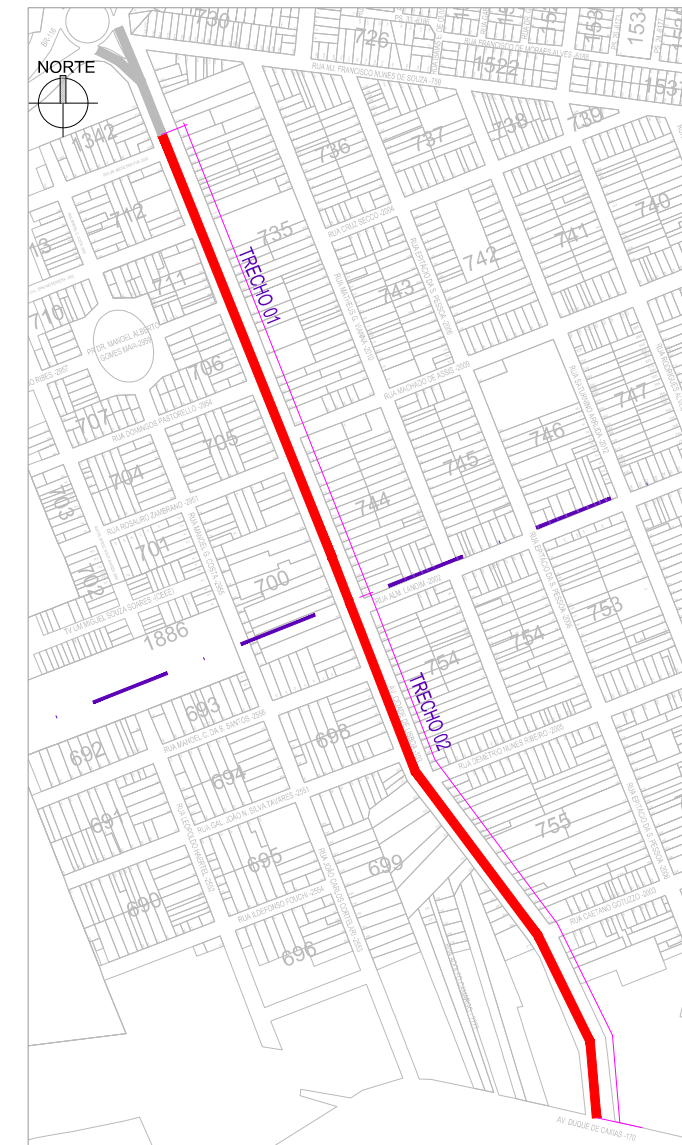
DIVISÃO DOS TRECHOS 01 E 02 S/ ESCALA